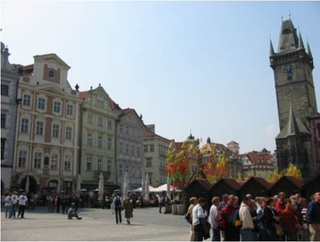
La grand'place (Slacestromestske), avec son horloge astronomique.

Et sa statue hommage à Jean Huss, fondateur de l'hérésie hussite à l'époque de la Réforme.